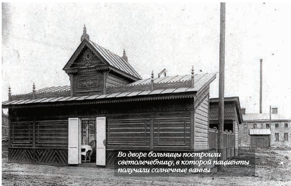
Во дворе больницы построили светолечебницу, в которой пациенты получали солнечные ванны