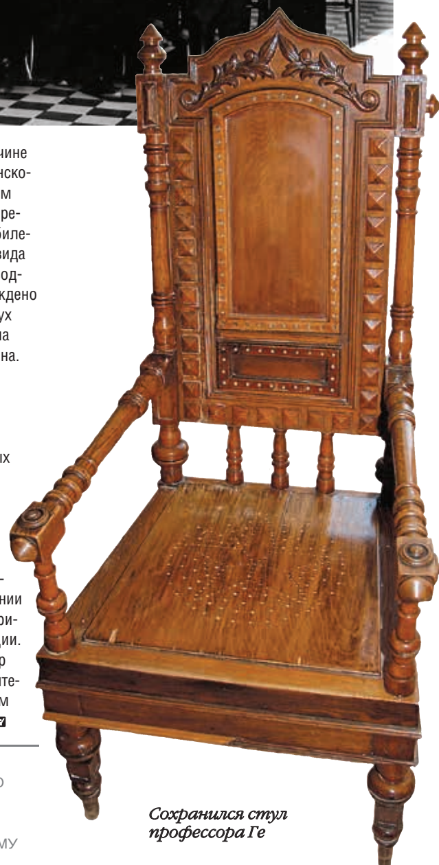
Сохранился стул профессора Ге

ФОТО ИЗ АРХИВОВ РЕСПУБЛИКАНСКОГО КЛИНИЧЕСКОГО КОЖНО-ВЕНЕРОЛОГИЧЕСКОГО ДИСПАНСЕРА РТ И КАФЕДРЫ ДЕРМАТОВЕНЕРОЛОГИИ КГМУ