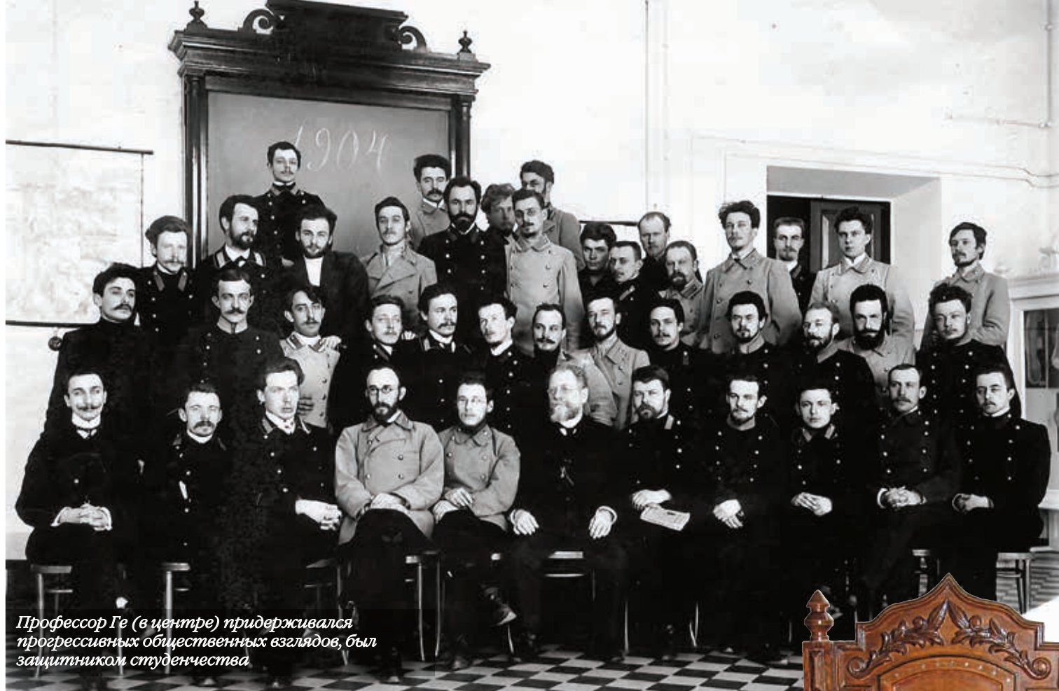
Профессор Ге (в центре) придерживался прогрессивных общественных взглядов, был защитником студенчества