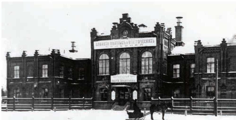
С 1900 года новая университетская клиника стала центром научной и практической дерматовенерологии России

просить министра народного просвещения Российской империи о постройке новых клиник. При этом предполагалось первоочередное строительство здания для лечения сифилитиков, душевных, детских и нервных болезней.