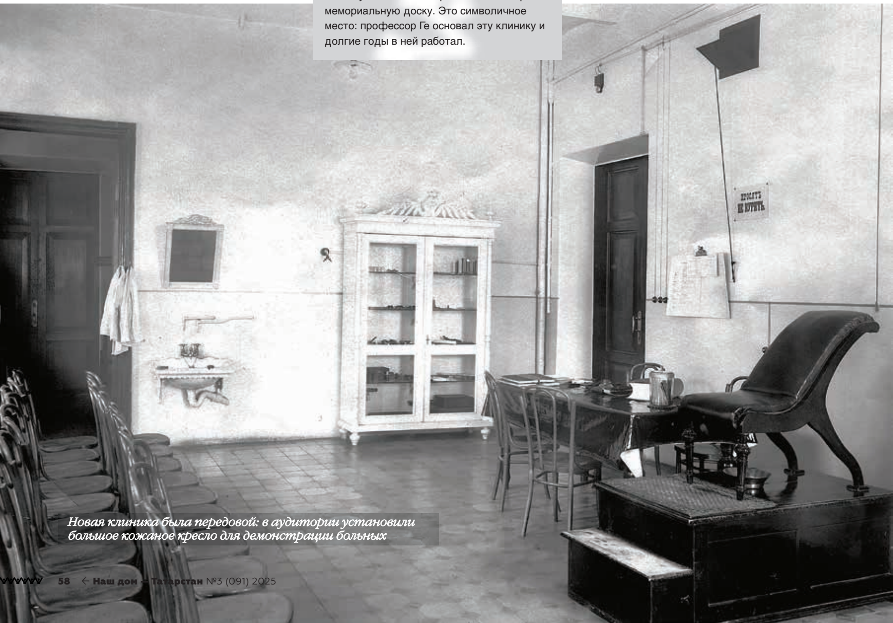
Новая клиника была передовой: в аудитории установили большое кожаное кресло для демонстрации больных

22 августа 1888 года на заседании медицинского факультета университета было принято решение